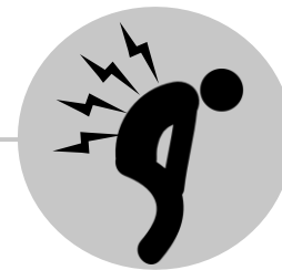
Dolor muscular y de cuerpo