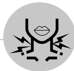
Rigidez en el cuello