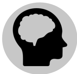
Inflamación del cerebro