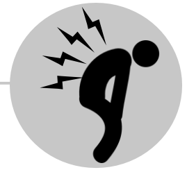
Đau nhức khắp người và đau bắp thịt