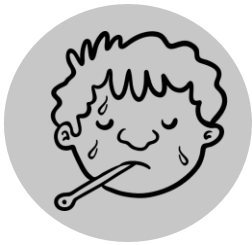
Sốt và lạnh run